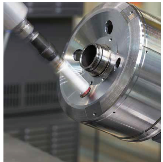
Zum Entgraten der Rotorträger werden am Roboter verschiedene Werkzeuge eingesetzt.